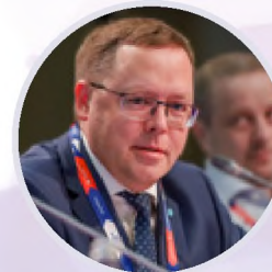
Андрей Карпов Председатель правления Российской Ассоциации экспертов рынка ритейла