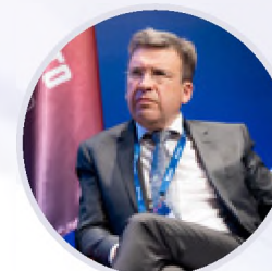
Владлен Максимов Президент Ассоциации малоформатной торговли России