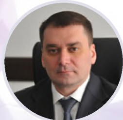
Алексей Гусев Министр торговли и услуг Республики Башкортостан