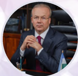
Андрей Назаров Премьер-министр Республики Башкортостан