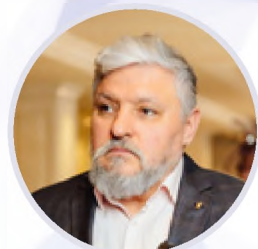
Игорь Бухаров Президент Федерации Рестораторов и Отельеров России