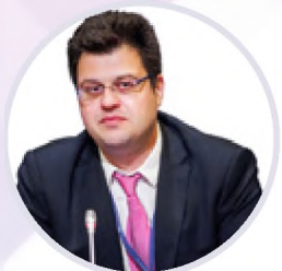
Никита Кузнецов Директор Департамента развития внутренней торговли Минпромторга России