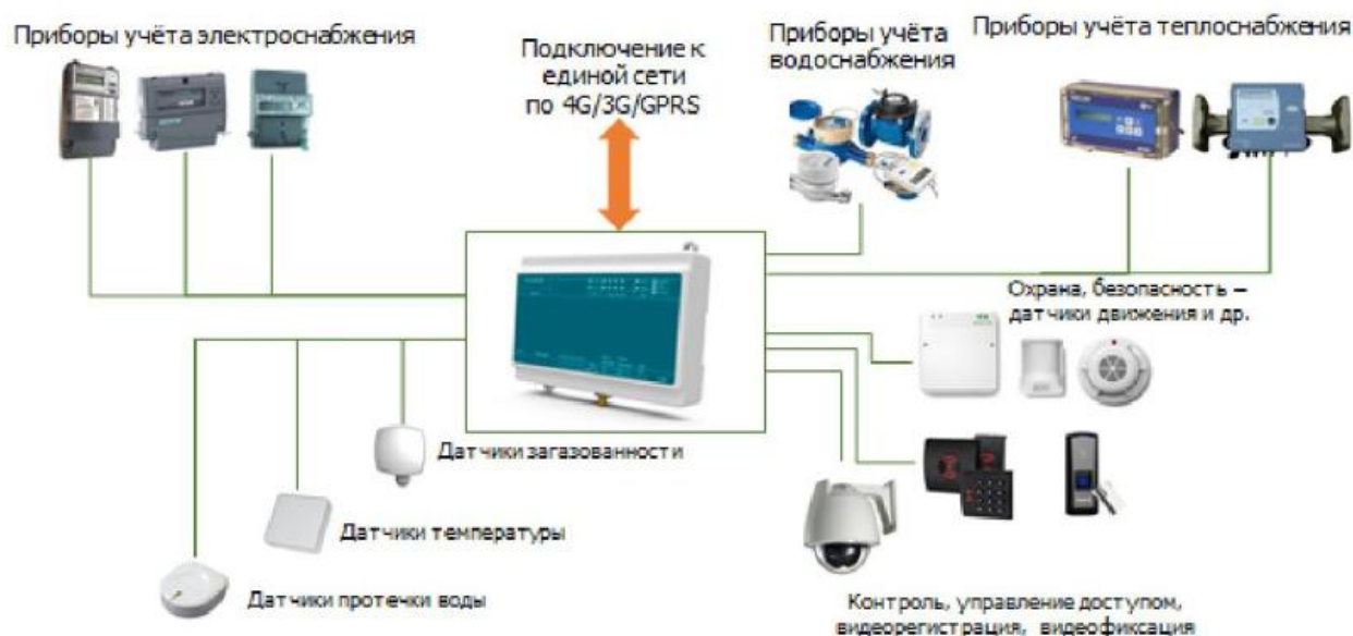
Рис.1 Системы контроля и учета потребления энергоресурсов