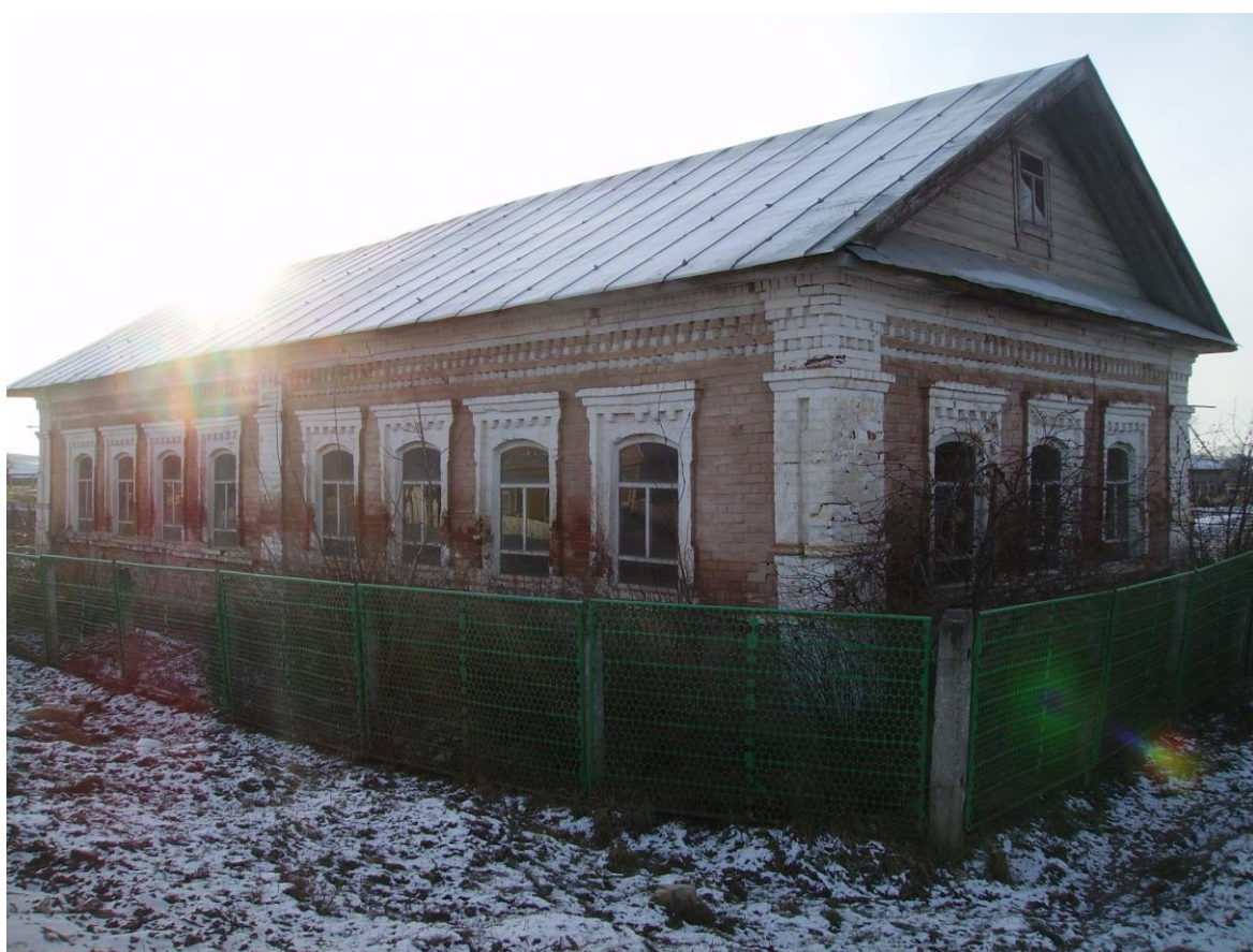
Медресе Сатышево 1890 г.

фасадов сочетаются элементы архитектуры классицизма и татарского народного зодчества.